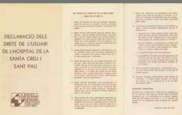
Primera carta de drets dels usuaris de la sanitat de l'Estat

1984. Es fa el primer trasplantament de cor de l'Estat amb èxit.