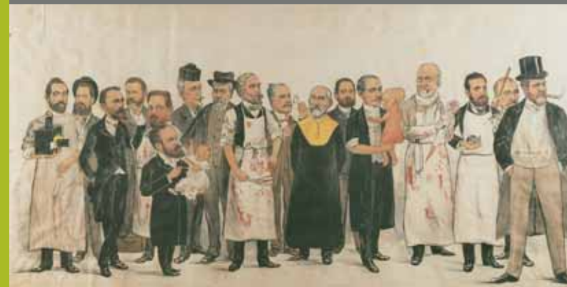
Caricatura de professors de la Facultat de Medicina (1886)