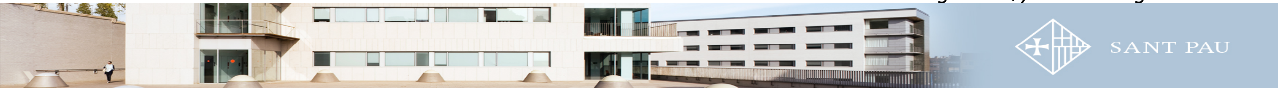
Residencia Dermatología MQ y Venereología Sant Pau