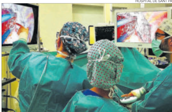
▶▶ Operació d'una pacient amb càncer de pulmó a Sant Pau.