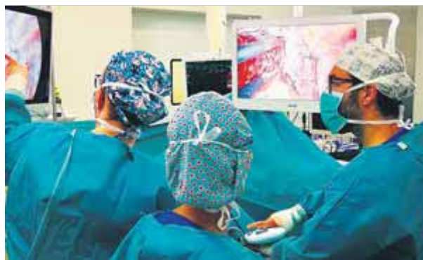
Operació d'una pacient amb càncer de pulmó amb una tècnica pionera a l'hospital de Sant Pau de Barcelona

■ L'hospital de Sant Pau practica una tècnica pionera a Catalunya