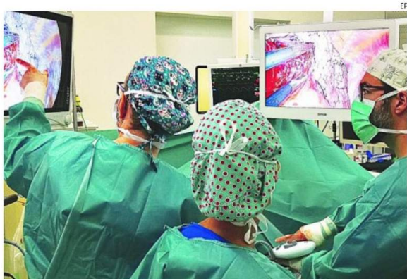
La técnica permite extirpar el lóbulo pulmonar afectado y los ganglios