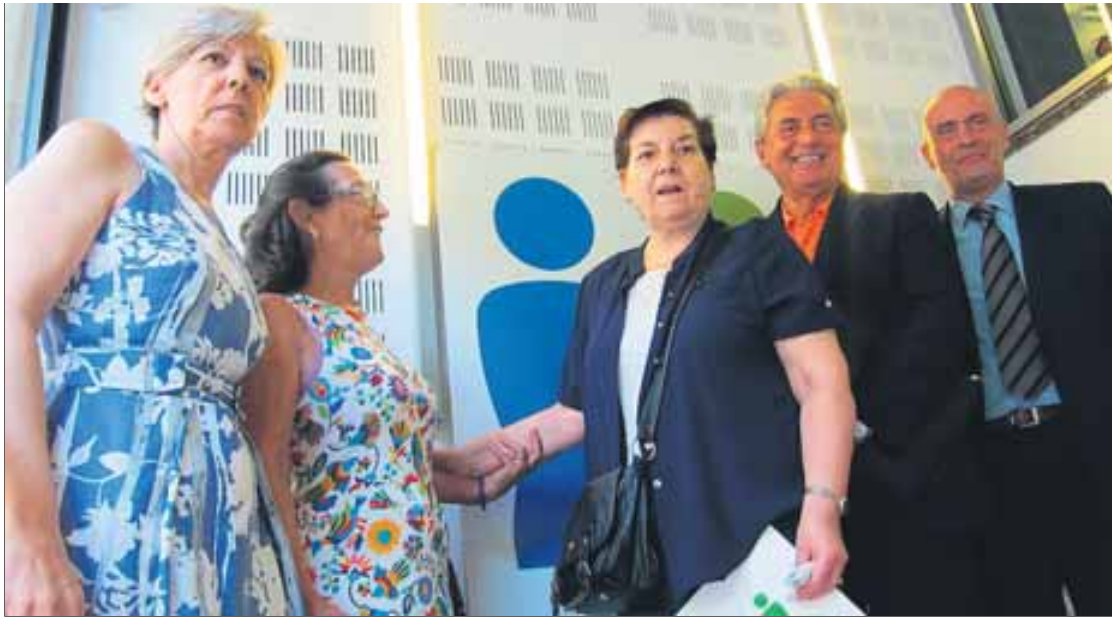
El neuròleg Blesa , el president de l'AFAB, la presidenta de la Fafac i dues familiars de malalts ■ E.P.