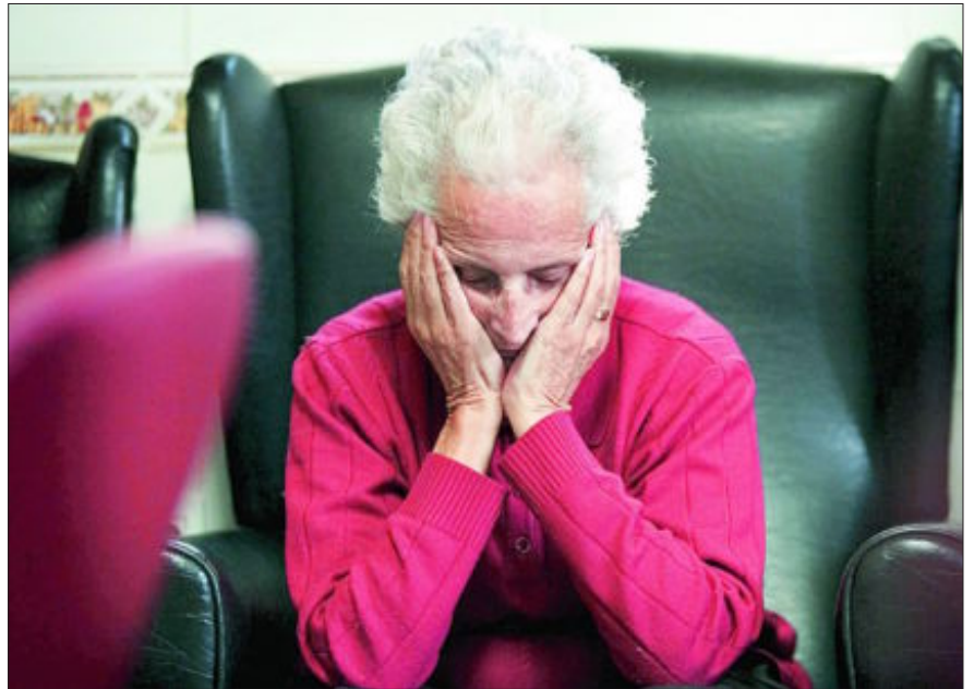
En Cataluña, más de 120.000 personas padecen Alzheimer, la mayoría mayores de 60 años

También es conocido que evitando ciertos factores de riesgo se puede, en cierto modo, incidir sobre algunos aspectos de la enfermedad. La práctica del ejercicio físico, evitar el consumo del alcohol y tabaco, así como el mantenimiento de una dieta equilibrada ayudan a prolongar el estado del bienestar cognitivo. Pero el jefe del