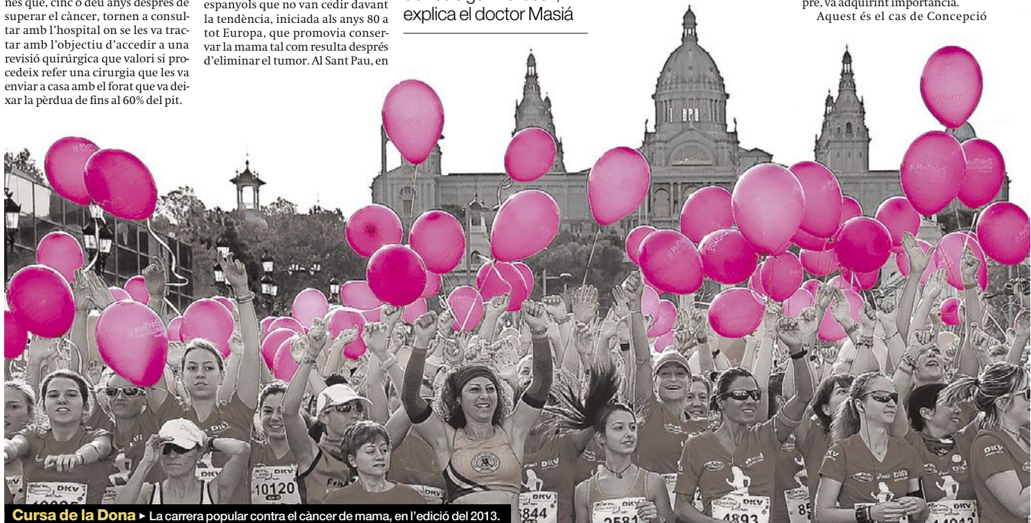
Cursa de la Dona ▶ La carrera popular contra el càncer de mama, en l'edició del 2013.